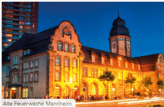
Alte Feuerwache Mannheim

Anlässlich des diesjährigen DGKJP Kongresses der Deutschen Gesellschaft für Kinder- und Jugendpsychiatrie, Psychosomatik und Psychotherapie, organisierte CPO einen Gesellschaftsabend in der Alten Feuerwache in Mannheim. Bei Speis und Trank sowie Live Musik wurde in der denkmalgeschützten Location – eine ehemalige Wagenhalle für Löschzüge und Rettungsfahrzeuge – bis spät in die Nacht gefeiert.